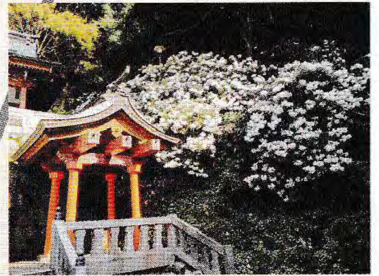
八楽奥之院(しゃくなげ寺)