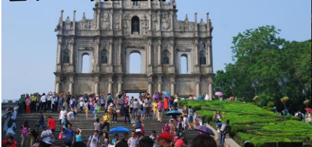
マカオ世界文化遺産 聖ポール天主堂跡